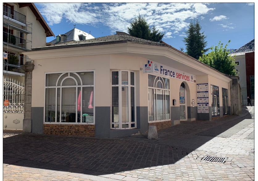
Une maison France Services à Embrun (05)

* « Légitime défiance », Alexis Spire (éditions Puf). « Ceux qui restent », Benoît Coquart (édition La Découverte).