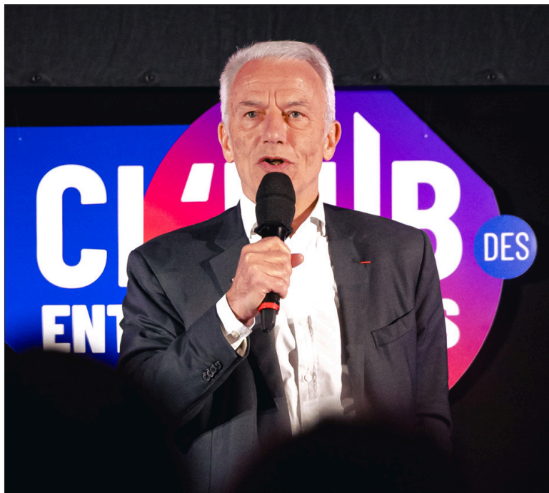
Patrick Martin, président du Medef.

Premièrement, nous doter de fondamentaux économiques solides, à commencer par la réduction du poids de notre dette publique et l'enrayement des déficits, conditions de la réduction