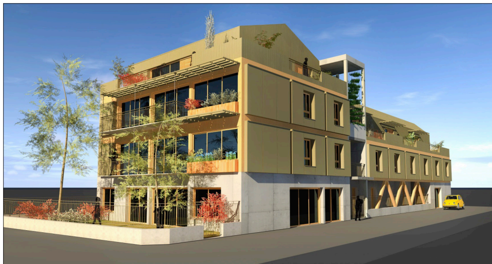
Le projet de résident à vocation d'emploi rue Joseph Garnier à Dijon (27 logements).