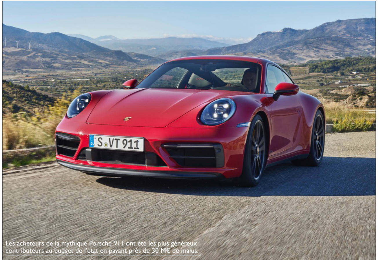
Les acheteurs de la mythique Porsche 911 ont été les plus généreux contributeurs au budget de l'état en payant près de 30 M€ de malus.

Ventes. L'unité de production nordiste de Toyota d'Onnaing a de nouveau battu un record en 2025, faisant des Yaris et Yaris Cross les voitures les plus assemblées en France.