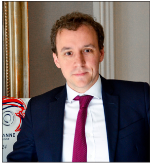
Paul-Antoine de Carville, maire de la ville de Sens.

♦ Donc nous, on a programmé 45 propositions qu'on va mettre en place. Plus d'autres qui se mettront en place dans le mandat, parce qu'il y a toujours des nouvelles propositions qui arrivent en cours de mandat. Ces 45 propositions, on les chiffre à 78M€ d'investissement : pour