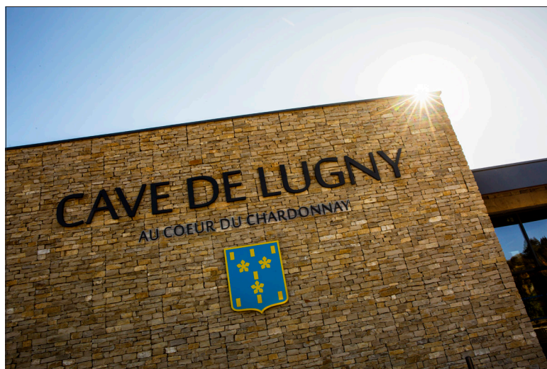
La cave de Lugny compte 181 exploitations sur 1277 ha et produit à 89 % du chardonnay.

Côte-d'Or. Le site, inauguré le 23 avril, est le 8 e de ce type ouvert par Suez en région BFC.