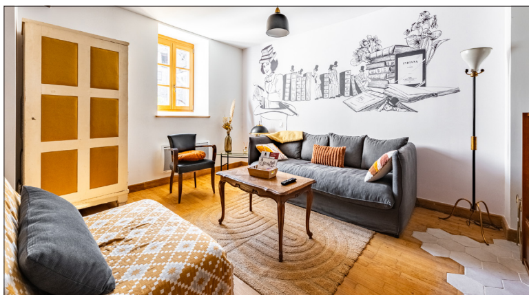
Chaque chambre possède une identité singulière, portée par une direction artistique forte qui donne à l'ensemble une véritable cohérence. Ici, le logis George Sand.