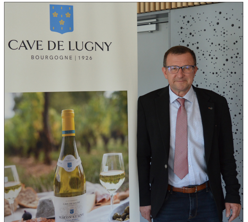
Le président Sangoy invite à rester lucide : « Il faut poursuivre cette trajectoire mais l'année 2026 sera compliquée avec toutes les incertitudes économiques, politiques et climatiques. »

La coopérative a par ailleurs validé l'achat d'un domaine de 9 ha à Lugny avec la possibilité d'installer