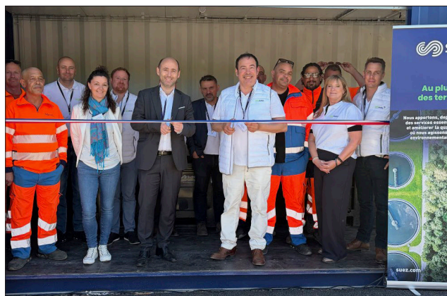
L'achat comptoir permet aux professionnels, aux particuliers ou encore aux associations de venir déposer, en un seul lieu, leurs déchets de métaux ferreux et non ferreux.

Ce site constitue le 8 e comptoir ouvert par Suez dans la région BFC, après ceux de Perrigny, Auxerre, Torcy et Nevers. Les investissements réalisés début 2026 visent à améliorer l'accessibilité du site