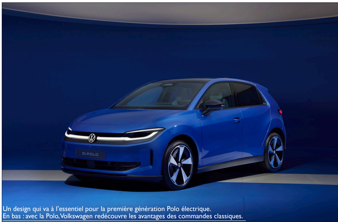
Un design qui va à l'essentiel pour la première génération Polo électrique. En bas : avec la Polo, Volkswagen redécouvre les avantages des commandes classiques.

Disposant de multiples aides à la conduite allant jusqu'à la conduite semi-autonome, proposées en série ou en option, l'ID. Polo est équipée du système « one pedal driving » qui permet de se passer d'utiliser la pédale de frein, en ralentissant uniquement