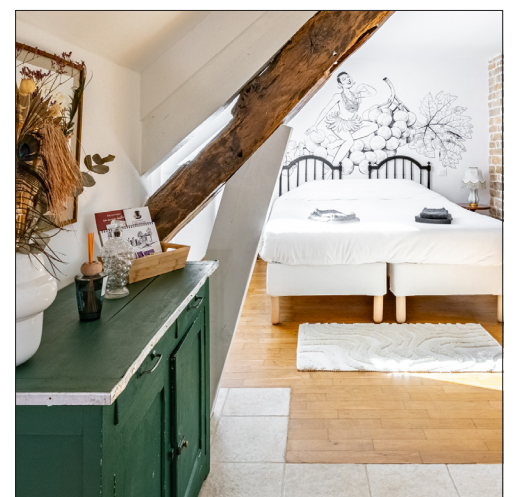
Les chambres arborent chacune une fresque exclusive signée de l'artiste illustrateur Kariko, dédiée aux mairaines des logis.