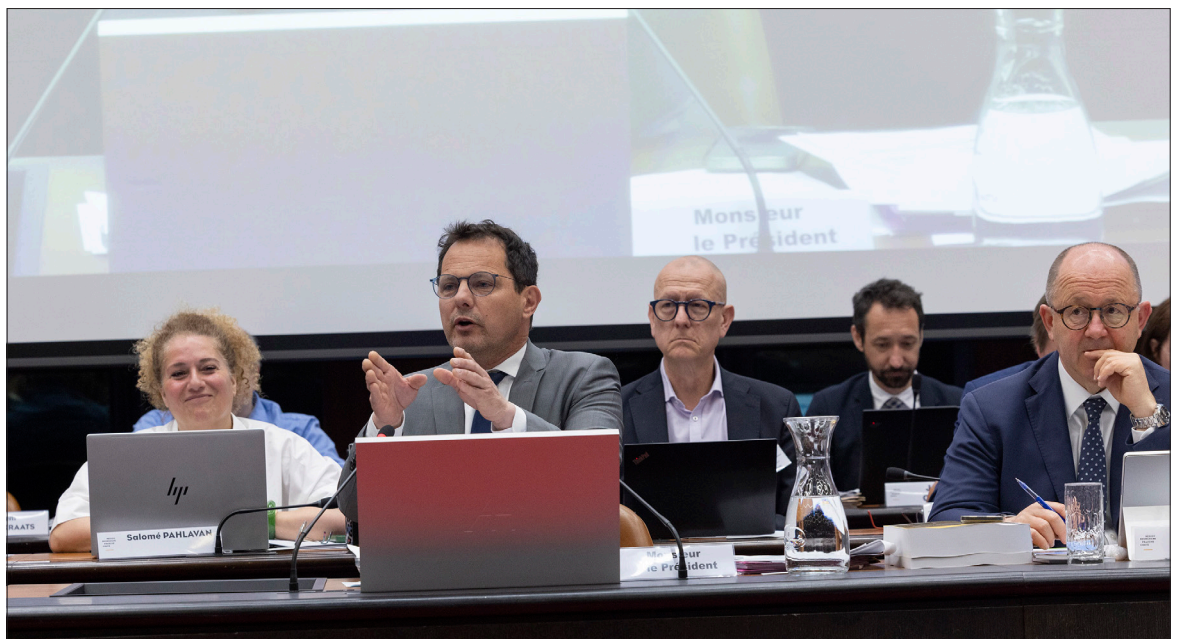
Jérôme Durain, président de la région BFC, lors de l'assemblée plénière des 29 et 30 avril.

Cette ambition agricole est indissociable de la gestion de l'eau, sujet sur lequel la région a adopté une feuille de route stratégique pour 2026-2030. Face à l'accélération des sécheresses et à la vulnérabilité du territoire situé en tête de trois bassins hydrographiques, la collectivité souhaite engager une « transition hydrique concrète ». Pour le