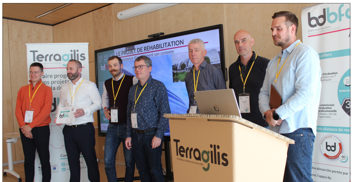
L'équipe responsable de la réhabilitation du bâtiment BB3 de la City à Besançon passait devant la commission BDBFC, jeudi 11 juin, pour évaluer leur projet en face conception.