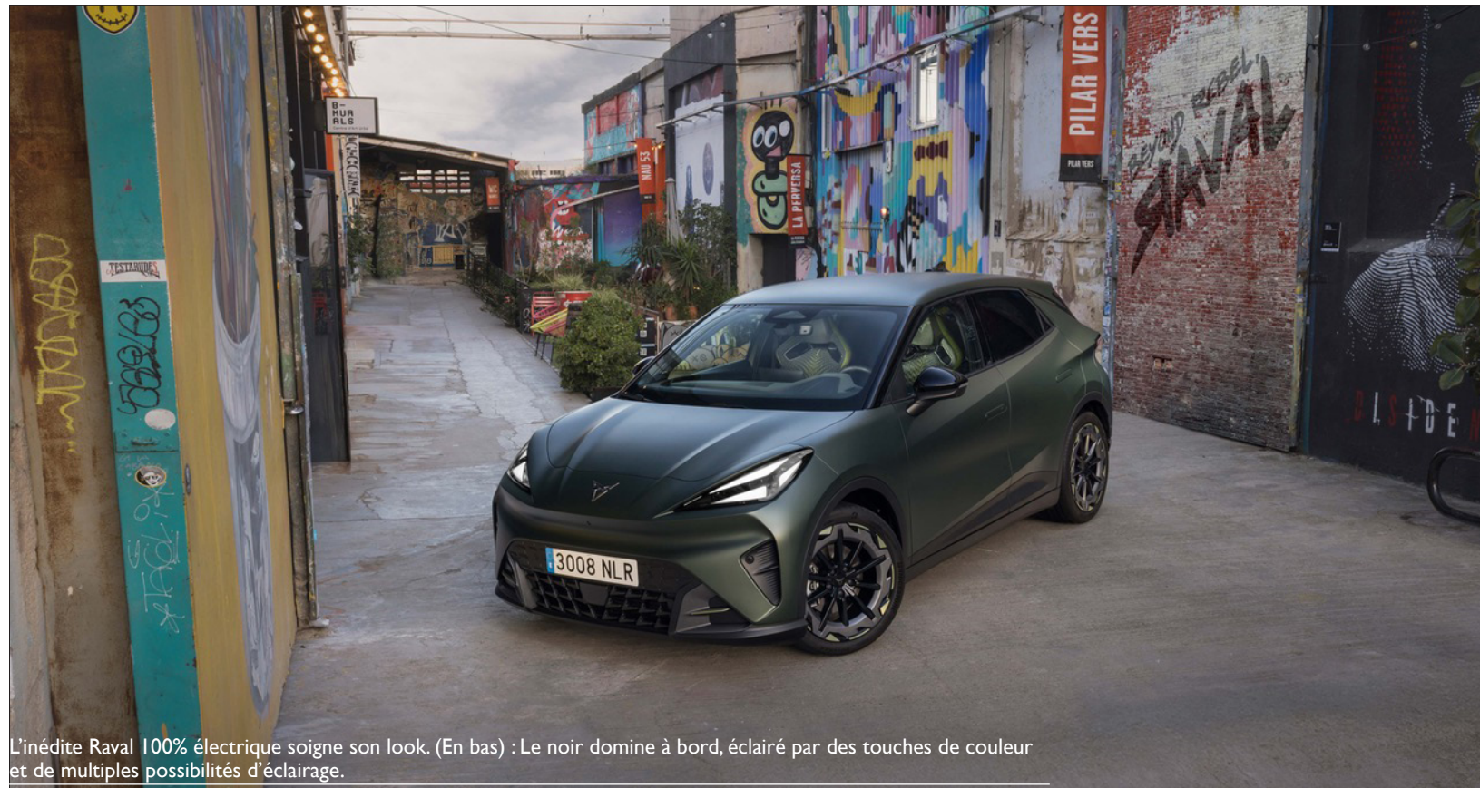
L'inédite Raval 100% électrique soigne son look. (En bas) : Le noir domine à bord, éclairé par des touches de couleur et de multiples possibilités d'éclairage.

Cette exubérance ibérique s'exprime de façon contrastée à bord à travers des ambiances différentes selon les quatre niveaux de finition. Si la dominante commune est noire, les variations jouent à la fois sur les habillages, les matériaux, les incrustations et les désormais inévitables et multiples jeux de lumière destinés à créer une ambiance personnalisée. De façon plus prosaïque, on note une double dalle numérique de 10,25 pouces derrière le volant pour les informations de conduite et un écran central de 12,9 pouces rassemblant les