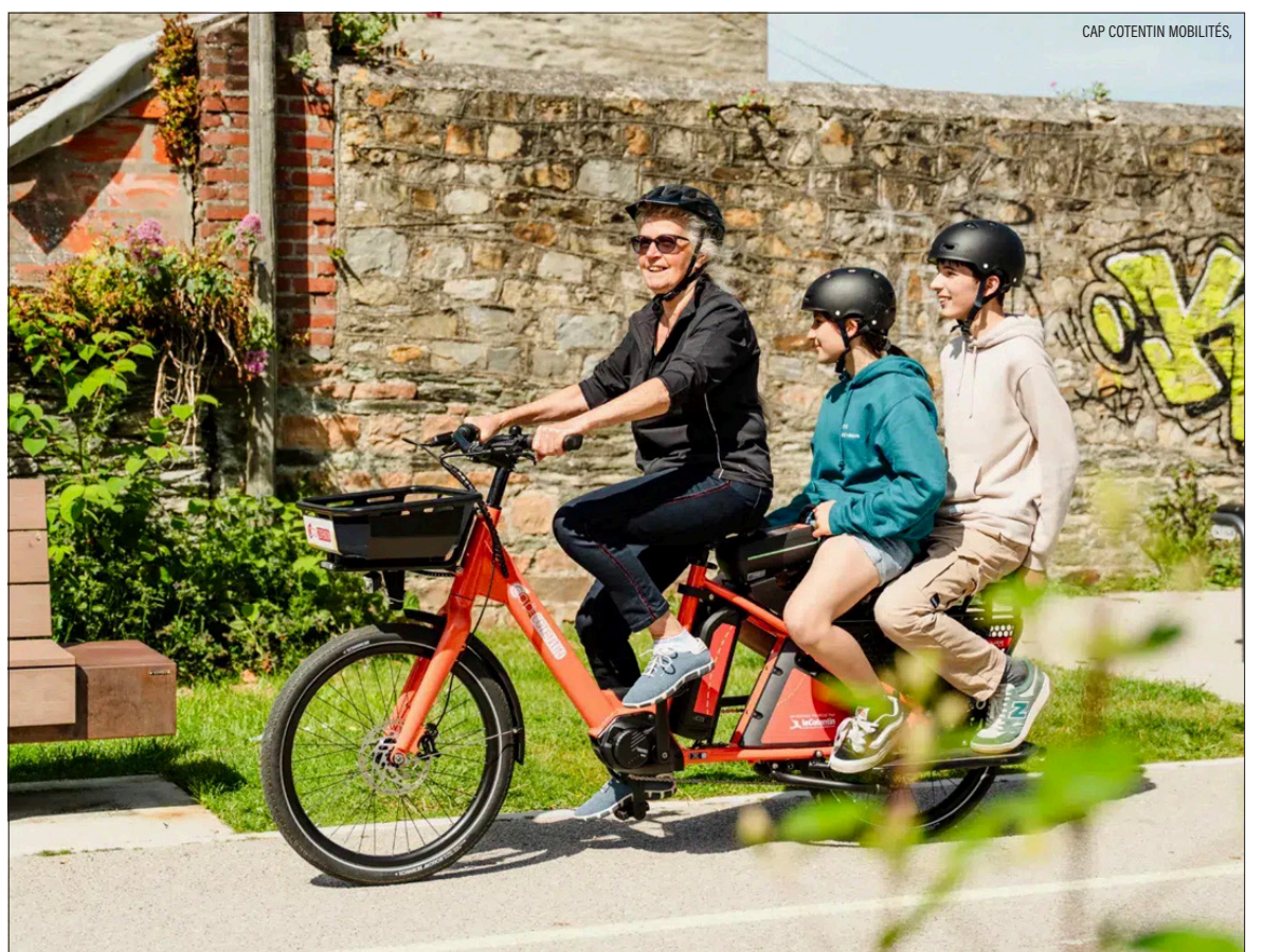
CAP COTENTIN MOBILITÉS

Une diversification précieuse après plusieurs années mouvementées pour la filière du vélo. Porté par l'engouement post-Covid, le marché a ensuite connu une phase de correction brutale, marquée par une concurrence accrue et une forte pression sur les prix. « Nous avons traversé des périodes difficiles comme l'ensemble du secteur. Beaucoup d'acteurs se sont lancés sur le marché du vélo cargo